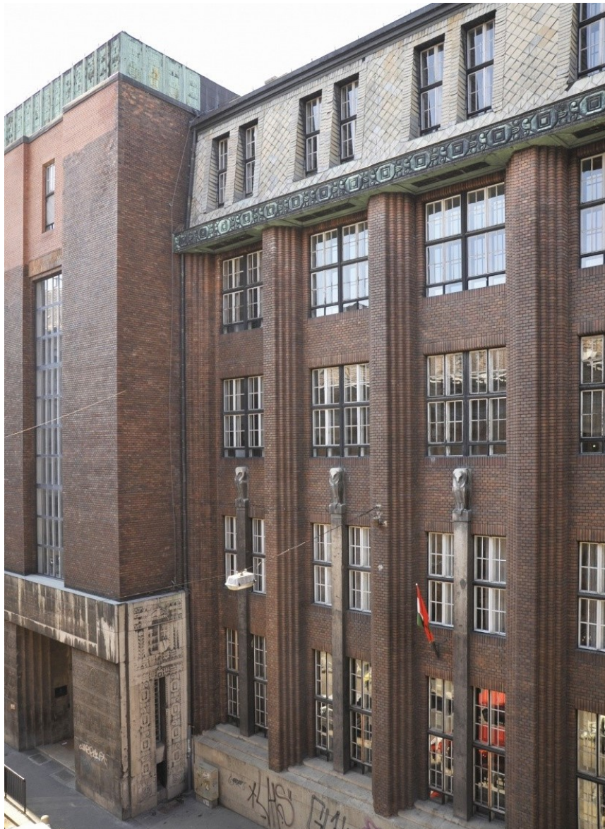
Az iskola épülete a beszögelléssel

A Lajta Béla tervezte Kereskedelmi Szakiskola homlokzati kialakítása olyan, hogy a két szélső, toronyszerű épületrész között a fal síkja kb. 25 m hosszúságban 2,5 m-rel beljebb van.